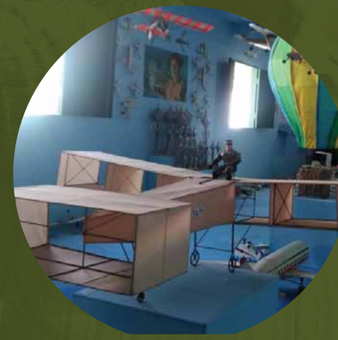
Museu Oficina do Mestre Françuli