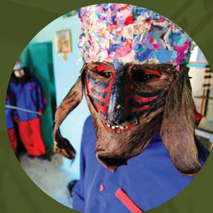
Máscara do Reisado de Caretas

Área dedicada à preservação do bioma caatinga no qual é possível vivenciar a experiência de observação de aves da região, prática conhecida internacionalmente como birdwatching .