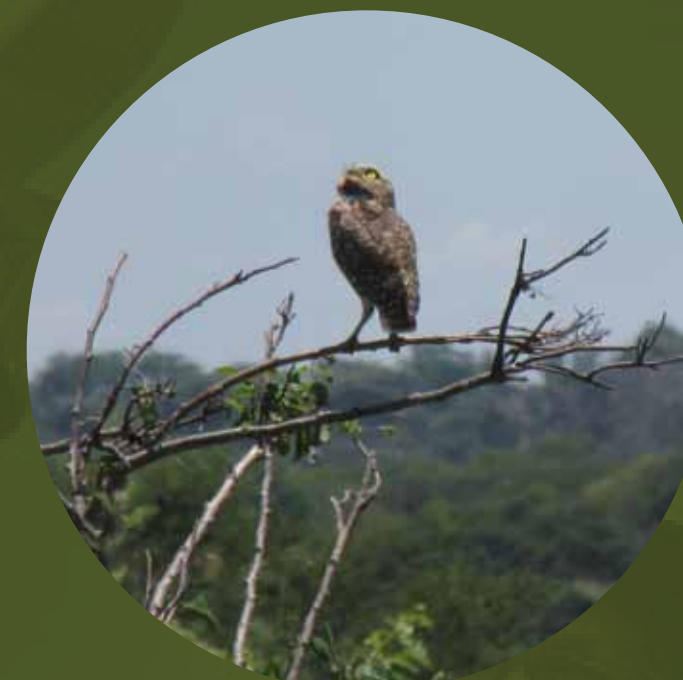
Observação de aves no Sítio do Pau Preto