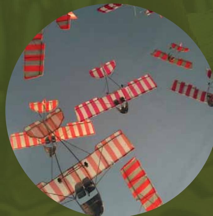
Museu Oficina do Mestre Françuli